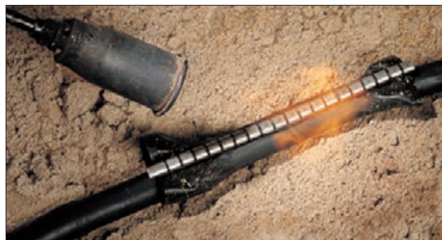
Kabelreparaturmanschetten – für die schnelle und sichere Reparatur vor Ort.