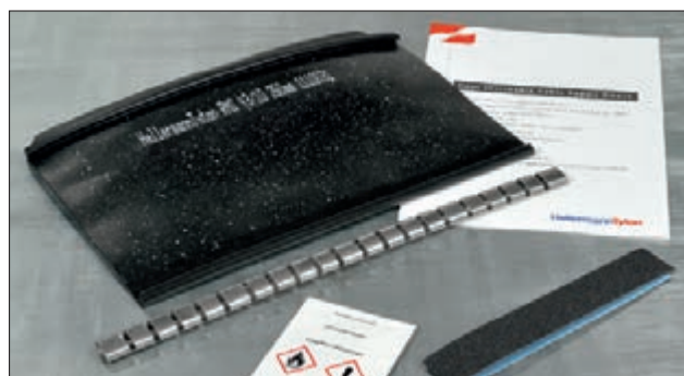
Lieferumfang: Kabelreparaturmanschette, Verschlusschiene, Reinigungstuch, Schmirgelleine, Montageanleitung.