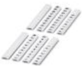
Zackband flach, bestellbar: streifenweise, weiß, beschriftet nach Kundenangaben, Montageart: verrasten in flacher Schildchennut, für Klemmenbreite: 5 mm, Schriftfeldgröße: 5,15 x 5,15 mm

Zackband flach - ZBF 5,LGS:FORTL.ZAHLEN - 0808671