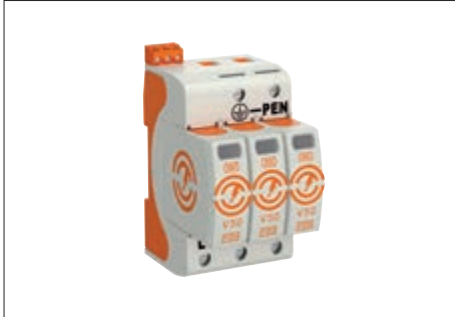
Blitzstrom- Kombiableiter Typ 1+2