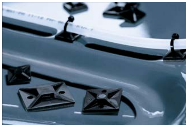
Durch das SolidTack Klebeband können die Sockel auch auf lackierte Oberflächen geklebt werden.