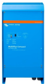
MultiPlus Compact 12/2000/80

Sind Systeme mit einem Color Control Panel an das Ethernet angeschlossen, kann auf sie zugegriffen werden und Einstellungen können aus der Ferne geändert werden.