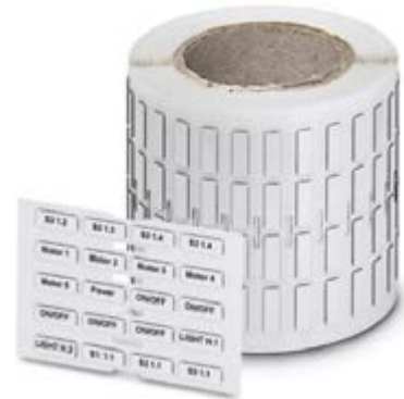
Abbildung zeigt ähnlichen Artikel

http://eshop.phoenixcontact.at/phoenix/treeViewClick.do?UID=0801820