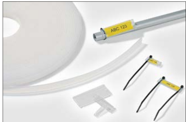
Vielseitig einsetzbar zur Kennzeichnung: Helafix HC und HCR.