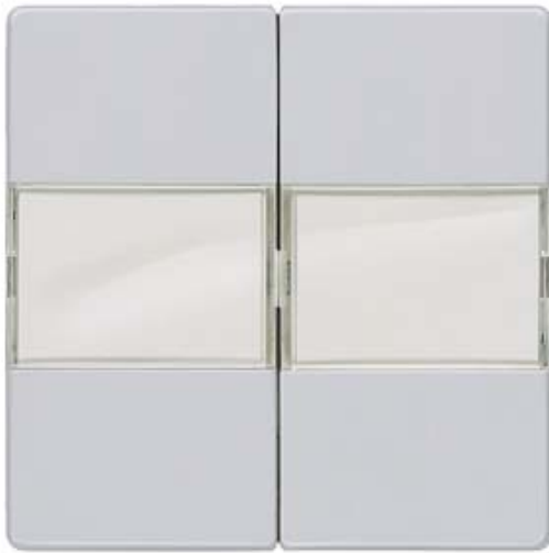
I-SYSTEM, ALUMINIUMMETAL. WIPPE MIT SCHILD F.SERIEN/DOPPEL-WECHSELSCHALTER 55X55MM