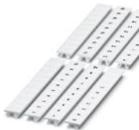
Zackband, 10-teilig, quer bedruckt mit den fortlaufenden Zahlen: 1 ... 10, weiß, Breite: 8 mm

Bitte beachten Sie, dass die hier angegebenen Daten dem Online-Katalog entnommen sind. Die vollständigen Informationen und Daten entnehmen Sie bitte der Anwenderdokumentation. Es gelten die Allgemeinen Nutzungsbedingungen für Internet-Downloads. ( http://phoenixcontact.de/download )