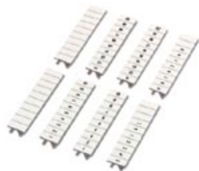
Zackband, 10-teilig, längs bedruckt mit den fortlaufenden Zahlen: 21 ... 30, weiß, Breite: 5 mm

Bitte beachten Sie, dass die hier angegebenen Daten dem Online-Katalog entnommen sind. Die vollständigen Informationen und Daten entnehmen Sie bitte der Anwenderdokumentation. Es gelten die Allgemeinen Nutzungsbedingungen für Internet-Downloads. ( http://phoenixcontact.de/download )