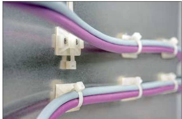
Befestigungssockel der TY-Serie sind als Schraub- oder Klebesockel erhältlich.