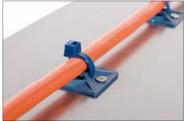
Detektierbare Befestigungslösung bestehend aus MCMB Sockel und MCT Kabelbinder.