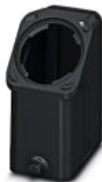
HEAVYCON EVO-Tüllegehäuse aus Kunststoff, mit Bajonettflansch für die EVO-Verschraubung, B10, für Längsbügel, Höhe 87,5 mm, ohne EVO-Verschraubung

Bitte beachten Sie, dass die hier angegebenen Daten dem Online-Katalog entnommen sind. Die vollständigen Informationen und Daten entnehmen Sie bitte der Anwenderdokumentation. Es gelten die Allgemeinen Nutzungsbedingungen für Internet-Downloads. ( http://phoenixcontact.de/download )