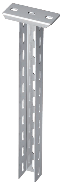
Hängestiel (U-Profil) mit angeschweißter Kopfplatte.