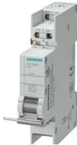
UNTERSpannungsauslöSER FÜR LS-SCHALTER DC 110V, MIT 2 KLEMMEN 17