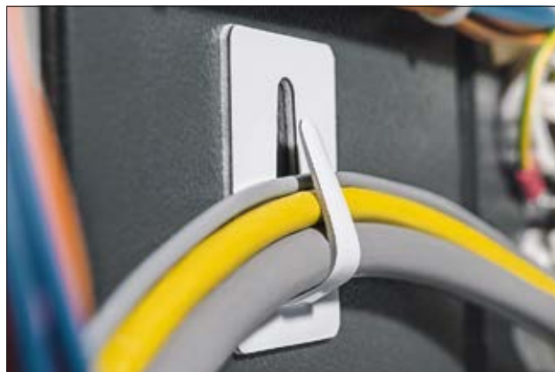
Die biegsame Metallnase ermöglicht die Befestigung von verschiedenen Kabeldurchmessern.