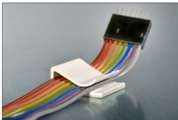
Befestigungssockel 130100 für Flachbandkabel.