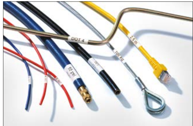
Einfache Etikettierung von flexiblen, halbflexiblen und starren Kabeln und Leitungen mit Helatag Kabellaminieretiketten.