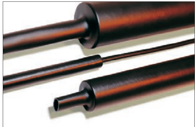
MA47 und MU47 - mittelwandig mit und ohne Innenkleber.