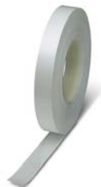
Abbildung zeigt Variante des Artikels

http://eshop.phoenixcontact.at/phoenix/treeViewClick.do?UID=0802688