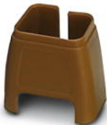
Farbmarkierung für Patch-Kabel, braun

Bitte beachten Sie, dass die hier angegebenen Daten dem Online-Katalog entnommen sind. Die vollständigen Informationen und Daten entnehmen Sie bitte der Anwenderdokumentation. Es gelten die Allgemeinen Nutzungsbedingungen für Internet-Downloads. ( http://phoenixcontact.de/download )