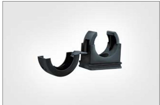
HelaGuard PACC Befestigungsschelle.