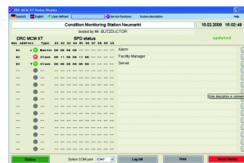
DRC MCM XT Status Display-Software

Hutschienengerät mit integriertem LifeCheck-Sensor für die zustandsorientierte Überwachung von max. 10 BLITZDUCTOR XT mit LifeCheck. Optische Ableiter-Zustandsmeldung über 3-Farben-LED kombiniert mit FM-Signalisierung (Öffner oder Schließer). Eine RS 485-Schnittstelle ermöglicht die Vernetzung von bis zu 15 DRC MCM XT.