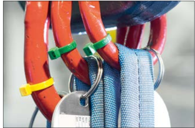
Kabelbinder der T-Serie - ideal zur farblichen Kennzeichnung.