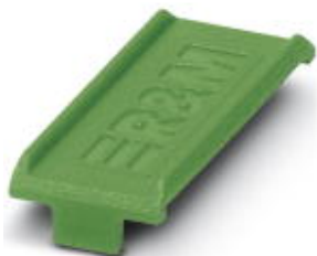
Farbmarkierung für FL PATCH GUARD, grün

Bitte beachten Sie, dass die hier angegebenen Daten dem Online-Katalog entnommen sind. Die vollständigen Informationen und Daten entnehmen Sie bitte der Anwenderdokumentation. Es gelten die Allgemeinen Nutzungsbedingungen für Internet-Downloads. (http://phoenixcontact.de/download)