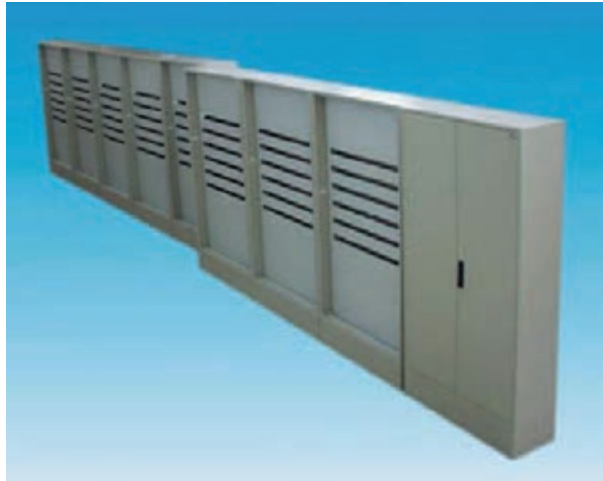
9 Stk. STM-D/400+S-D 100