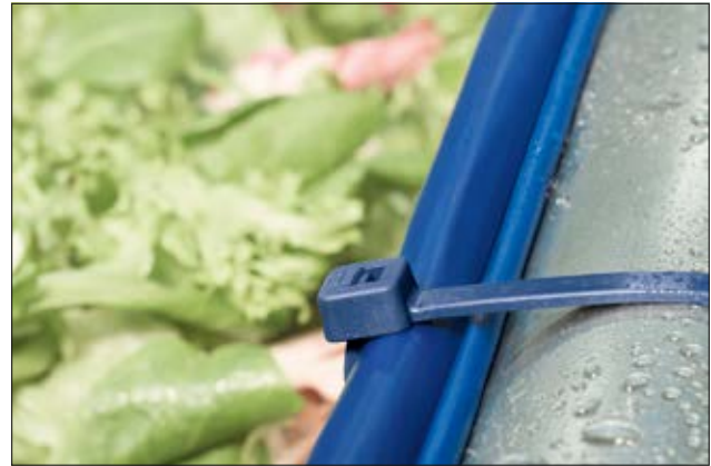
Unsere MCT(S) Kabelbinder zum Einsatz in der Lebensmittel- und Pharma-Industrie.