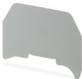
Trennplatte, Länge: 61 mm, Breite: 0,8 mm, Höhe: 45,5 mm, Farbe: grau

Bitte beachten Sie, dass die hier angegebenen Daten dem Online-Katalog entnommen sind. Die vollständigen Informationen und Daten entnehmen Sie bitte der Anwenderdokumentation. Es gelten die Allgemeinen Nutzungsbedingungen für Internet-Downloads. ( http://phoenixcontact.de/download )