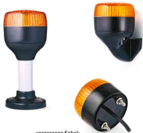
vergossene Kabel- isolierung/-einführung