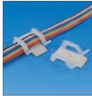
Befestigungssockel TY8H1(S) - je nach Anforderung schraubbar oder selbstklebend.