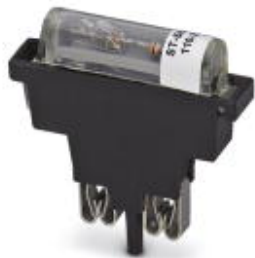
Sicherungsstecker, Nennstrom: 10 A, Länge: 45,4 mm, Breite: 9,9 mm, Farbe: schwarz

Bitte beachten Sie, dass die hier angegebenen Daten dem Online-Katalog entnommen sind. Die vollständigen Informationen und Daten entnehmen Sie bitte der Anwenderdokumentation. Es gelten die Allgemeinen Nutzungsbedingungen für Internet-Downloads. ( http://phoenixcontact.de/download )