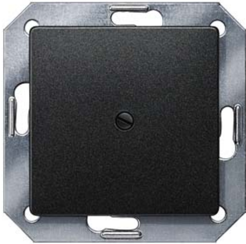
I-SYSTEM, CARBONMETALLIC BLINDPLATTE, 55X55M