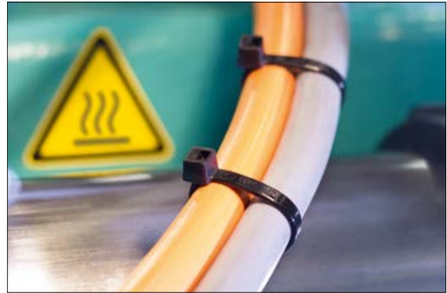
Hitzestabilisierte Kabelbinder der T-Serie bis +105 °C.