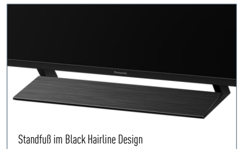
Standfuß im Black Hairline Design