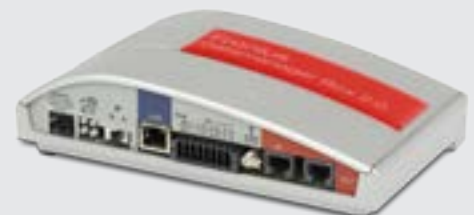
/ Fronius Datamanager Box 2.0

/ Komfortabler Support da der Fronius Datamanager den Wechselrichter direkt mit Fronius Solar.web verbindet.