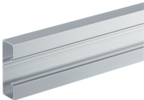
tehalit.BRAP Brüstungskanal Aluminium Unterteil 65x170mm, natureloxiert