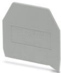
Abschlussdeckel, Länge: 43 mm, Breite: 1,5 mm, Höhe: 42 mm, Farbe: grau

Bitte beachten Sie, dass die hier angegebenen Daten dem Online-Katalog entnommen sind. Die vollständigen Informationen und Daten entnehmen Sie bitte der Anwenderdokumentation. Es gelten die Allgemeinen Nutzungsbedingungen für Internet-Downloads. ( http://phoenixcontact.de/download )