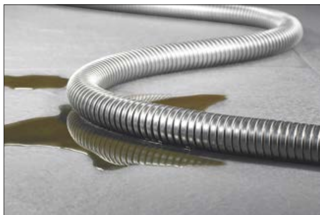
HelaGuard SSC Edelstahlschutzschlauch aus korrosionsbeständigem Edelstahl.