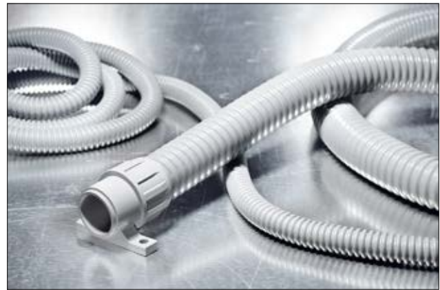
FlexiGuard FG mit Verschraubung FG-UH.