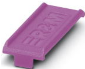
Farbmarkierung für FL PATCH GUARD, violett

Bitte beachten Sie, dass die hier angegebenen Daten dem Online-Katalog entnommen sind. Die vollständigen Informationen und Daten entnehmen Sie bitte der Anwenderdokumentation. Es gelten die Allgemeinen Nutzungsbedingungen für Internet-Downloads. (http://phoenixcontact.de/download)