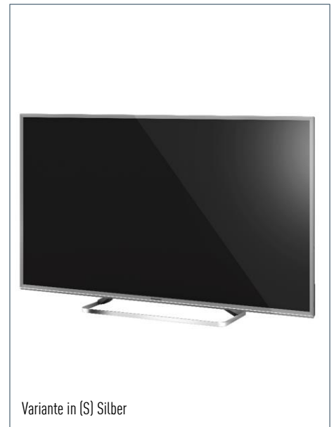
Variante in (S) Silber

USB Recording – Aufnahmemöglichkeit auf externe Festplatte