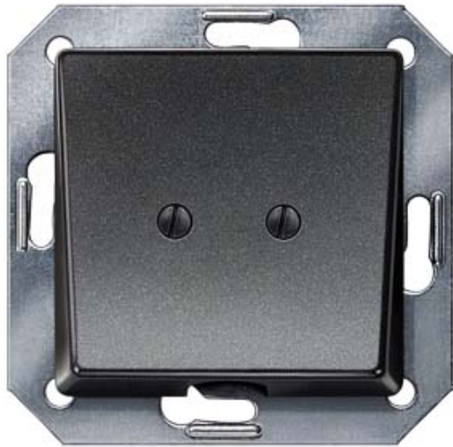
I-SYSTEM, CARBONMETALLIC AUSLASSPLATTE, 55X55MM