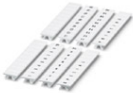
Zackband, 10-teilig, längs bedruckt mit den fortlaufenden Zahlen: 1 ... 10, weiß, Breite: 5 mm

Bitte beachten Sie, dass die hier angegebenen Daten dem Online-Katalog entnommen sind. Die vollständigen Informationen und Daten entnehmen Sie bitte der Anwenderdokumentation. Es gelten die Allgemeinen Nutzungsbedingungen für Internet-Downloads. ( http://phoenixcontact.de/download )