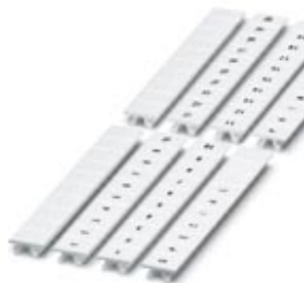
Zackband, 10-teilig, quer bedruckt mit den fortlaufenden Zahlen: 31 ... 40, weiß, Breite: 8 mm

Bitte beachten Sie, dass die hier angegebenen Daten dem Online-Katalog entnommen sind. Die vollständigen Informationen und Daten entnehmen Sie bitte der Anwenderdokumentation. Es gelten die Allgemeinen Nutzungsbedingungen für Internet-Downloads. ( http://phoenixcontact.de/download )