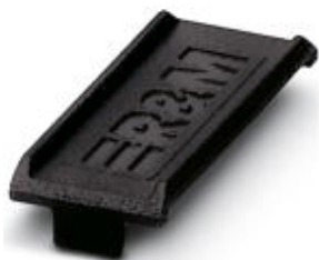
Farbmarkierung für FL PATCH GUARD, schwarz

Bitte beachten Sie, dass die hier angegebenen Daten dem Online-Katalog entnommen sind. Die vollständigen Informationen und Daten entnehmen Sie bitte der Anwenderdokumentation. Es gelten die Allgemeinen Nutzungsbedingungen für Internet-Downloads. ( http://phoenixcontact.de/download )