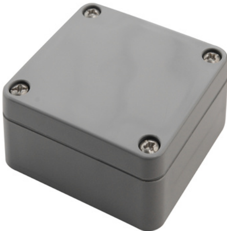
PK 101 Best.-Nr.: 38101000