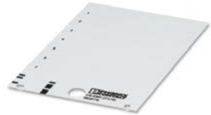
Abbildung zeigt eine Variante des Artikels

http://eshop.phoenixcontact.at/phoenix/treeViewClick.do?UID=0828776