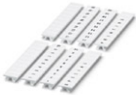
Zackband, 10-teilig, quer bedruckt mit den fortlaufenden Zahlen: 11 ... 20, weiß, Breite: 5 mm

Bitte beachten Sie, dass die hier angegebenen Daten dem Online-Katalog entnommen sind. Die vollständigen Informationen und Daten entnehmen Sie bitte der Anwenderdokumentation. Es gelten die Allgemeinen Nutzungsbedingungen für Internet-Downloads. ( http://phoenixcontact.de/download )