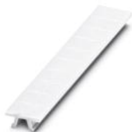
Zackband, 10-teilig, längs bedruckt mit den fortlaufenden Zahlen: 91 ... 100, weiß, Breite: 6 mm

Bitte beachten Sie, dass die hier angegebenen Daten dem Online-Katalog entnommen sind. Die vollständigen Informationen und Daten entnehmen Sie bitte der Anwenderdokumentation. Es gelten die Allgemeinen Nutzungsbedingungen für Internet-Downloads. ( http://phoenixcontact.de/download )