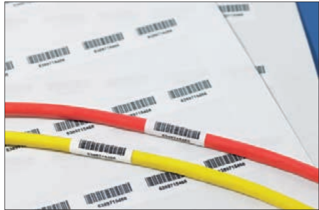
Helatag sorgt für die dauerhafte Kennzeichnung von Kabeln mit Barcodes.