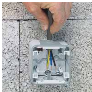
Zum Erreichen der Schutzart IP 55 1) Kabel leicht zurückziehen