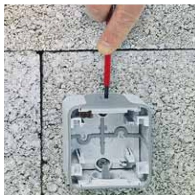
Durchstoßen der Membraneinführung mittels Schraubendreher

> Kabeleinführung geeignet für Kabelquerschnitte bis maximal 5 x 2,5 mm 2